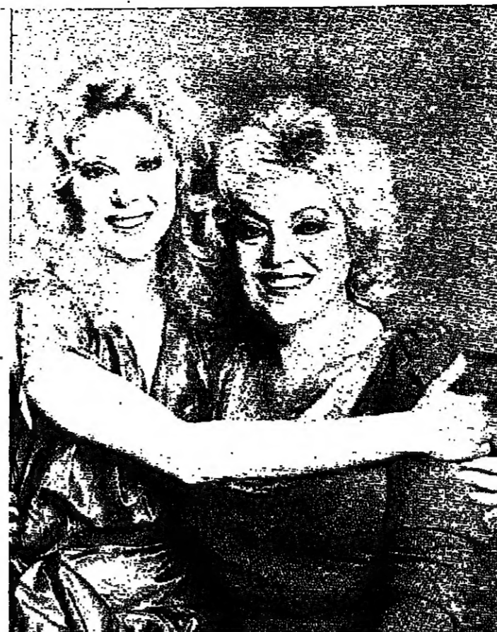
كثت مغنية قبل ان تقدم للشاشة الصغيرة كتمتلكه في مسلسل دالاس، الاميريكي. ان اوبري لانترن التي اوقعت شخصيات المسلسل في غرامها، تنتقل